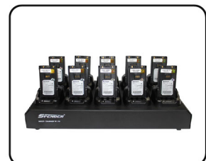
MULTICHARGER 10 BAYS (OPTION)

Contact: For more information about our products, please contact us.