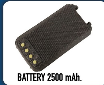
BATTERY 2500 mAh.