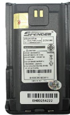
BATTERY 2600 mAh.