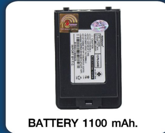
BATTERY 1100 mAh.