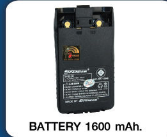
BATTERY 1600 mAh.